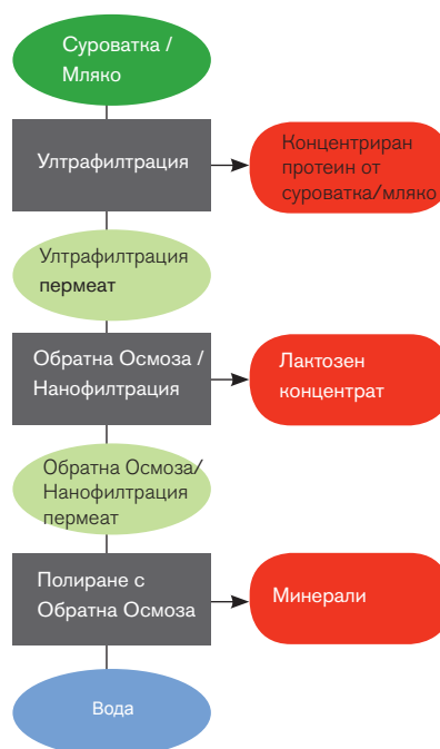
APV SepStream обработка на суроватка и мляко

APV SepStream системите се основават на солидни компоненти с доказана надеждност и дълга безпроблемна работа и поддръжка.